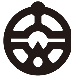
白抜き（ネガティブ表示）